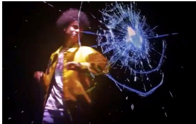
3D ホログラムを使用したパフォーマンスイメージ