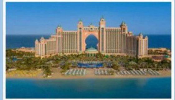
7 Nights/ 8 Days Dubai Package