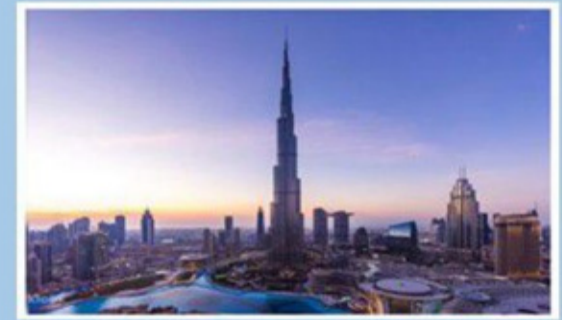
5 Nights/ 6 Days Dubai Package