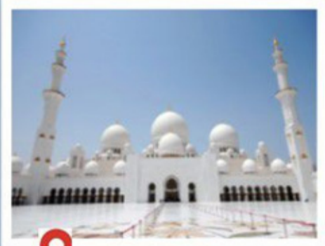
Abu Dhabi Tour