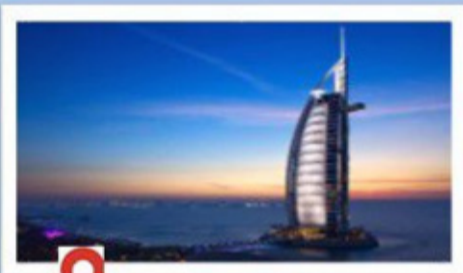
Dubai City Tour