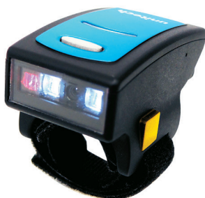
茂森科技股份有限公司 無線指環條碼掃描器MT500L