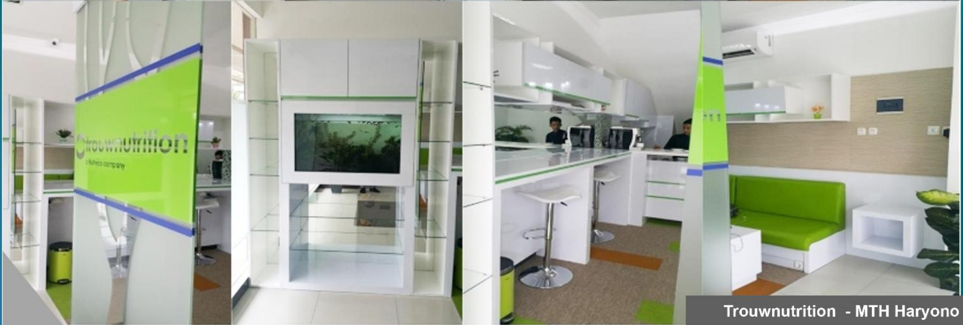
Trouw Nutrition - MTH Haryono