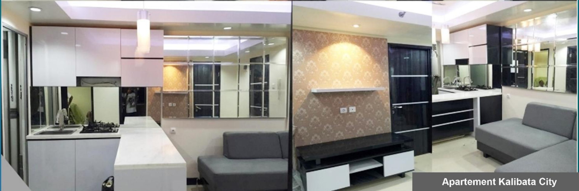
Apartment Kalibata City