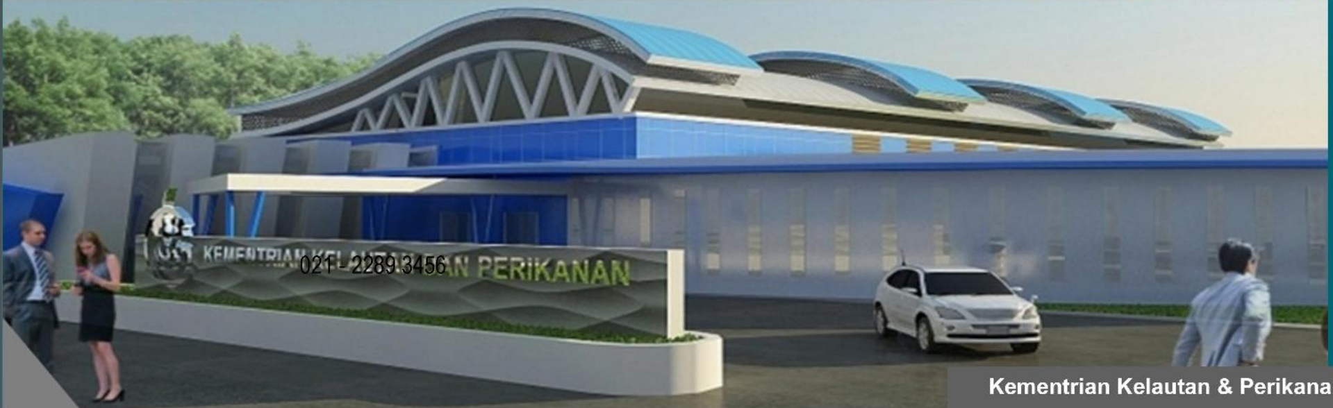
Kementerian Kelautan & Perikanan