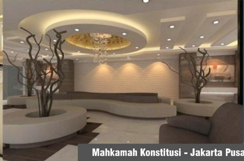
Mahkamah Konstitusi - Jakarta Pusat