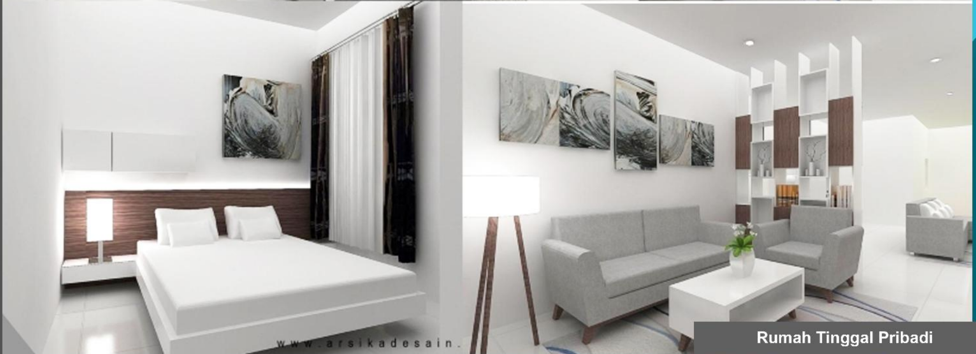
Rumah Tinggal Pribadi