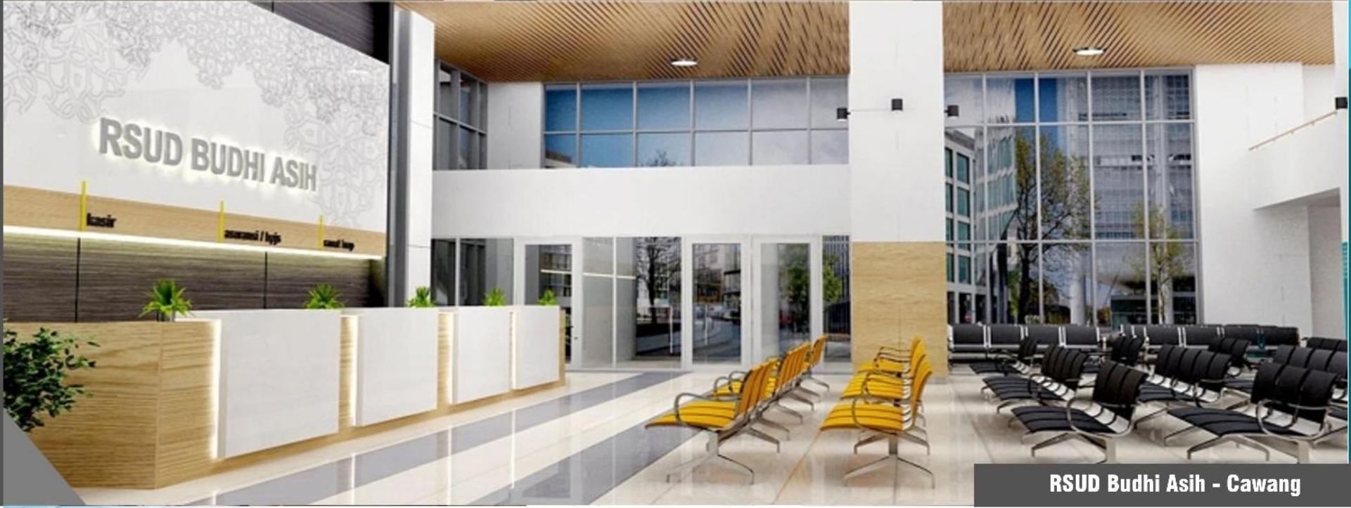
RSUD Budhi Asih - Cawang