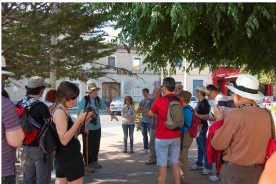
Punt d'encontre: la Plaça 9 d'Octubre de Beniarbeig.