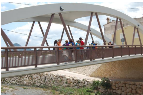
El pont nou sobre el Girona, el grup localitza a ponent dels pobles de la Rectoria i la Vall de Laguar