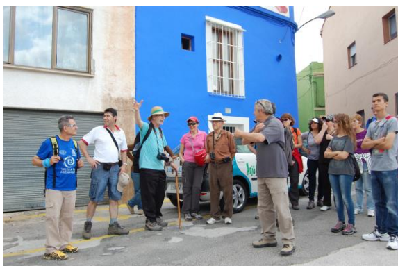
Localitzant el molí de Beniarbeig, en aquell temps tenia una bassa i desaguava al riu.