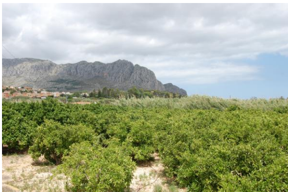
Vista dels tossals dels Vinyals i de Segària, des del camí d'Ondara, on es trobaven Roc Facadell i el doctor Llorca, entre altres personatges.