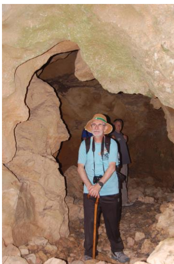
A la boca de l'avenc de Driss, en realitat l'avenc de Sigarra, al peu de Segària.