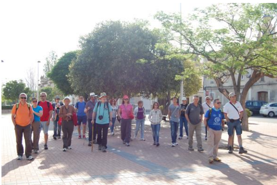
En el seu recorregut urbà, el barranc ha estat canalitzat recentment. Seguint el seu curs, avancem cap al camí de Segària, els Facadell ho haurien fet amagats entre la vegetació entre les hortes que vorejaven el jaç fluvial.