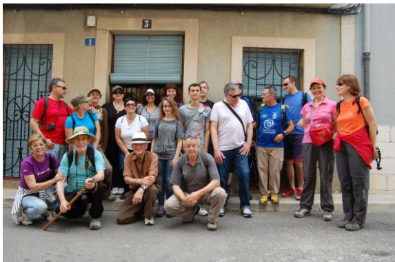
El grup davant un casa on podria haver estat la dels Facadell.