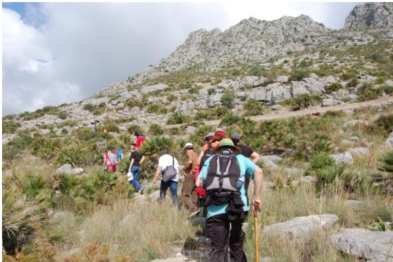
Segària, lloc de pastors i refugi de bandolers.