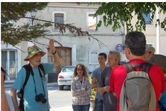
Resulta difícil de creure que per sota d'aquesta plaça passa el barranc de Segària, sec la major part del temps però cabalós si plou a la muntanya. En qualsevol cas, és un indret molt determinant en la vida tradicional del poble.