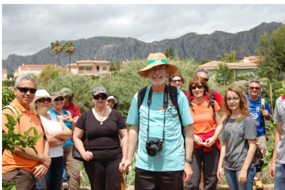
Pel camí vell d'Ondara. Darrere els canyars, que voregen el riu, el lloc on hi havia el garroferar de Palala, entre Beniarbeig i Benicàdim.