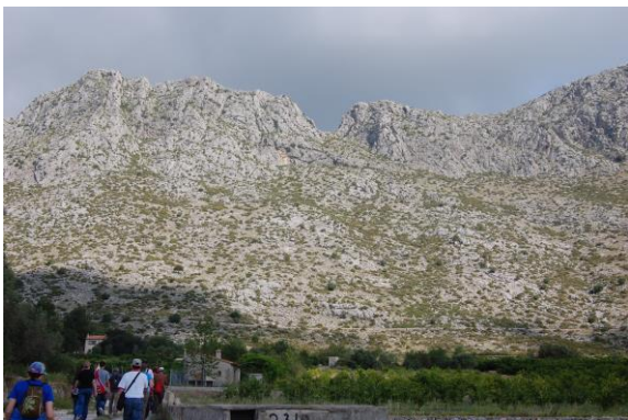
Pel camí de Segària, escenari d'alguna trobada entre Roc Facadell i Vicent Gadea.