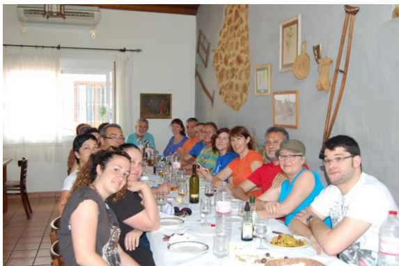
Dinar després de la passejada.