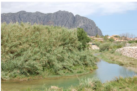
Meandre del riu Girona a llevant de Beniarbeig, aci hi havia un assut per a regar les Hortes de Baix.