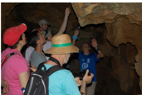
Interior de la cova