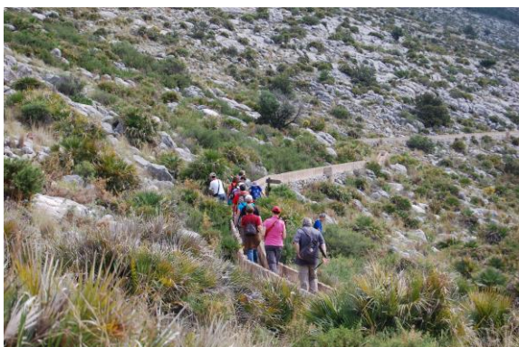
Planejant per la falda de Segària